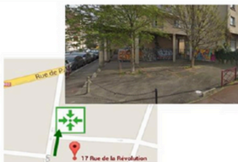
Point de rassemblement