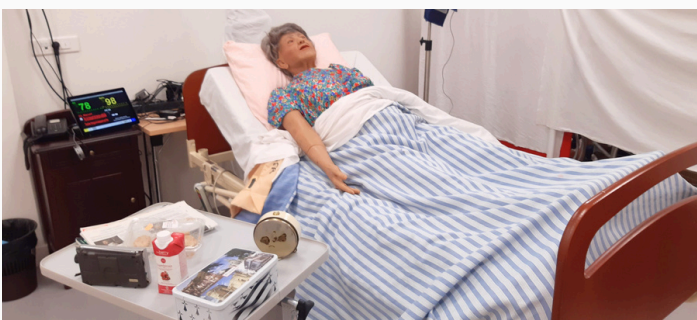
SALLE DE SIMULATION

Reconstitution d'une chambre en EHPAD, MAS ou domicile