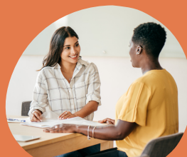
Avec un employeur

L'entrée en formation se déroule sur deux phases de sélection :