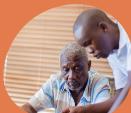
Avec un employeur